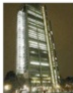
LA TORRE Il grattacielo Intesa in corso Inghilterra